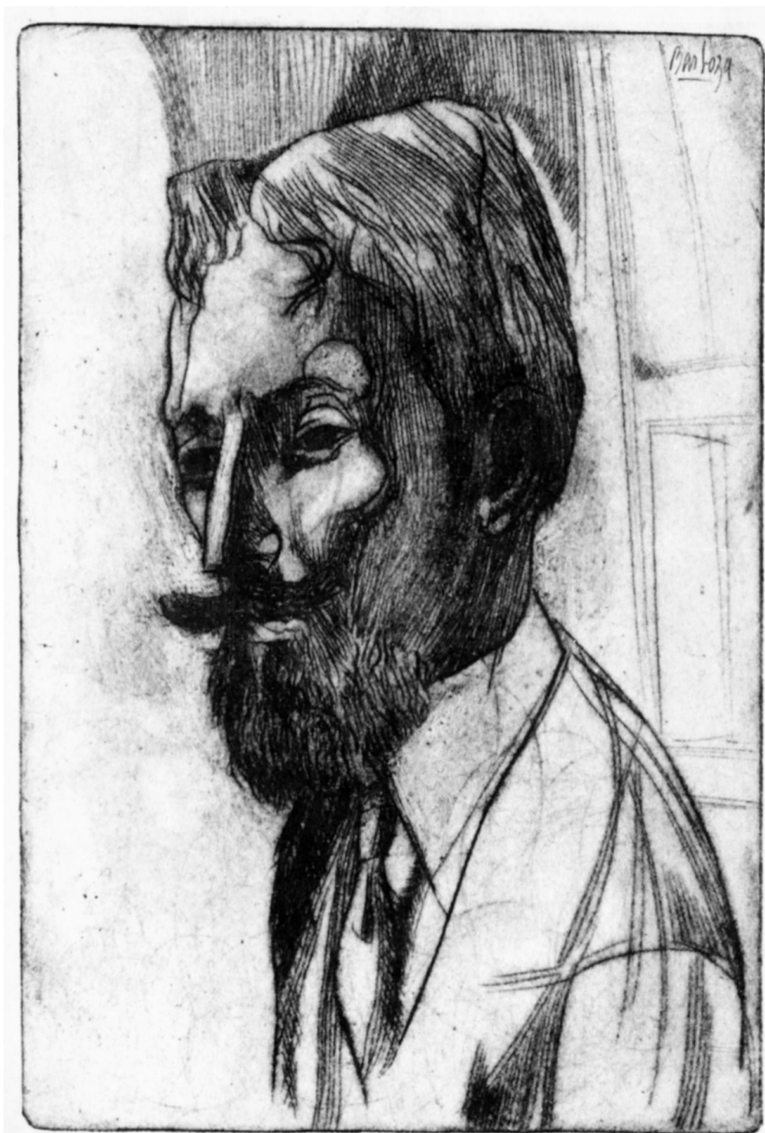
HORACIO QUIROGA (1878-1937)