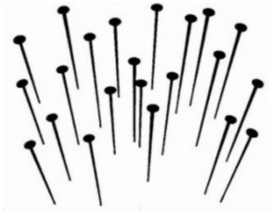
FIGURA 4. Los clavos se ponen en pie

En ciertas circunstancias, también la visión monocular puede crear una ilusión de profundidad. Mirando una fotografía con un solo ojo a través de un tubo se produce un ligero efecto de tridimensionalidad. Una de las más llamativas ilusiones de la visión monocular puede verse en la Figura 4.