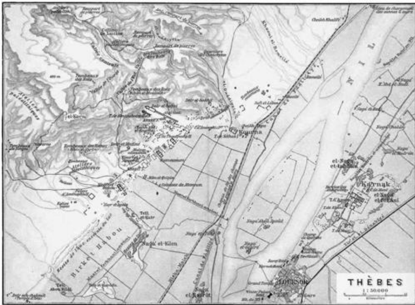
Mapa de la antigua Tebas, con los templos de Luxor y Karnak en la orilla este del Nilo