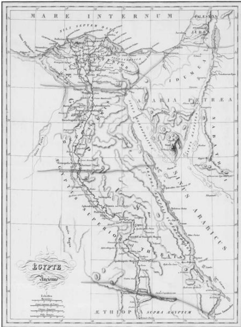
Mapa del antiguo Egipto