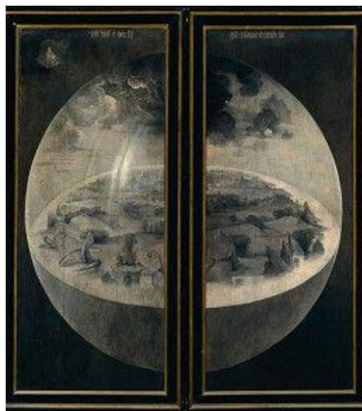
El jardín de las delicias. Cerrado: «La creación».

De Fiore creía que la historia debía estudiarse o bien desde la creación hasta el nacimiento de Jesús o bien desde el nacimiento de Jesús hasta su segunda venida, que él creía inminente. El monje llegó a esa conclusión después de razonar que ambos períodos históricos eran paralelos, duraban lo mismo y el uno se reflejaba en el otro. Como consecuencia, estudiando el primero se podría llegar a adivinar lo que sucedería en el segundo.