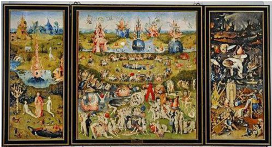
Sala 56a. Cat. P2823. 1500-1505. Óleo sobre tabla. 220 cm × 389 cm.

Esconde muchos misterios, su interpretación es muy discutida y ni siquiera podemos dar su nombre por seguro. Se la ha llamado El reino milenar , La pintura del madroño y, más recientemente, El jardín de las delicias . Pese a las controversias que ha generado siempre, su influjo es tan poderoso que fue una de las obras elegidas por Felipe II para llevarse a El Escorial y contemplarla durante su agonía.