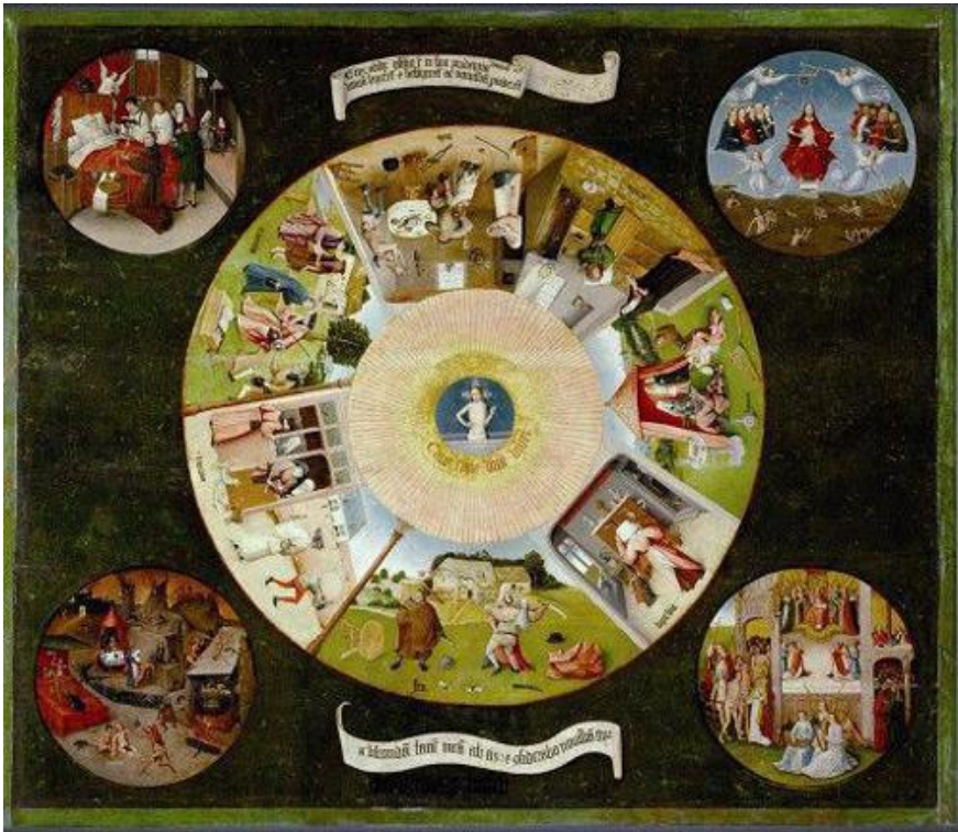
Sala 56a. Cat. P2822. Finales del siglo xv. Óleo sobre tabla. 120 cm × 150 cm.

Muestra las tentaciones a las que está sometida el alma, dispuestas en las siete secciones de un tondo que giran en torno a una imagen de Cristo que, según afirman los expertos, simboliza el ojo de Dios; se exhibe en la singular mesa