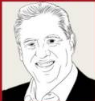
John C. Maxwell