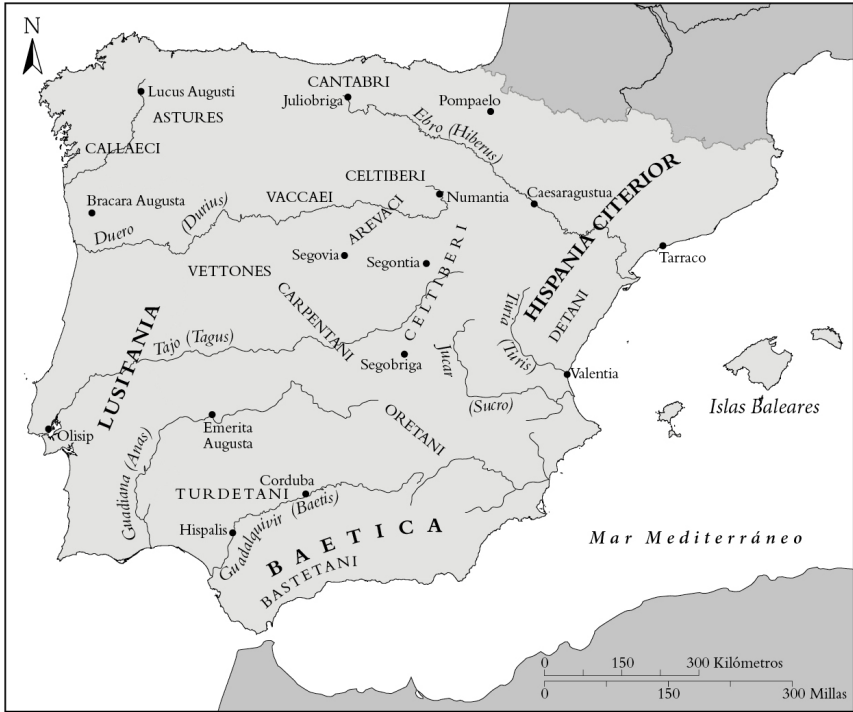
Mapa 2: La España romana.