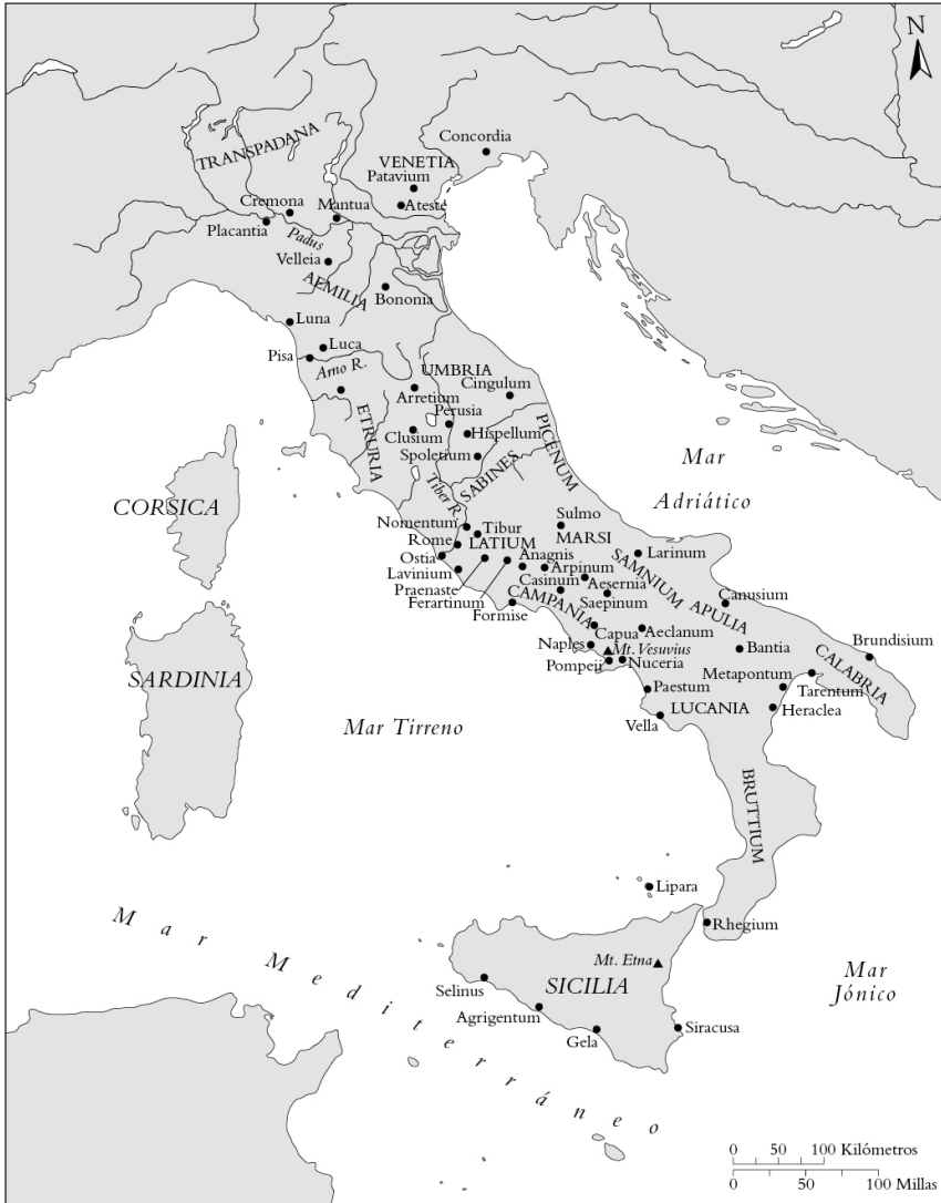
Mapa 3: Italia romana.