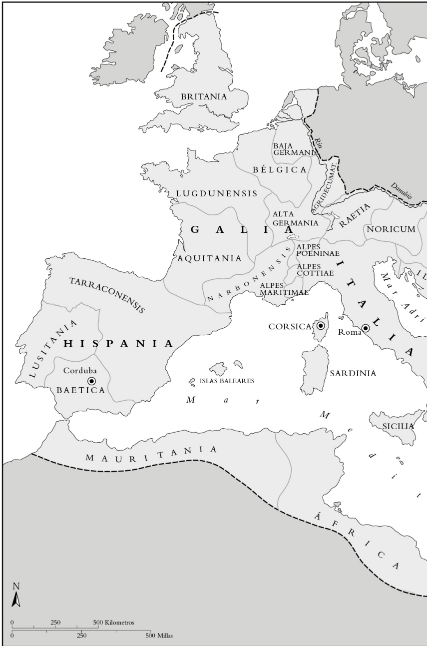
Mapa 1: El Imperio romano en tiempos de Séneca.