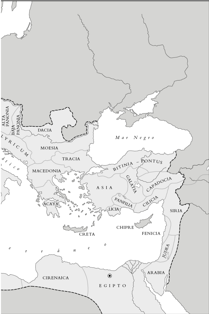
Mapa 1 (cont.).