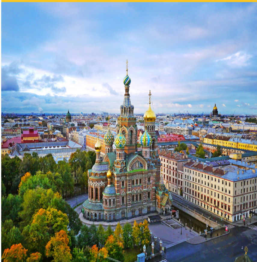
Iglesia del Salvador sobre la Sangre Derramada ( Clickar ), San Petersburgo.