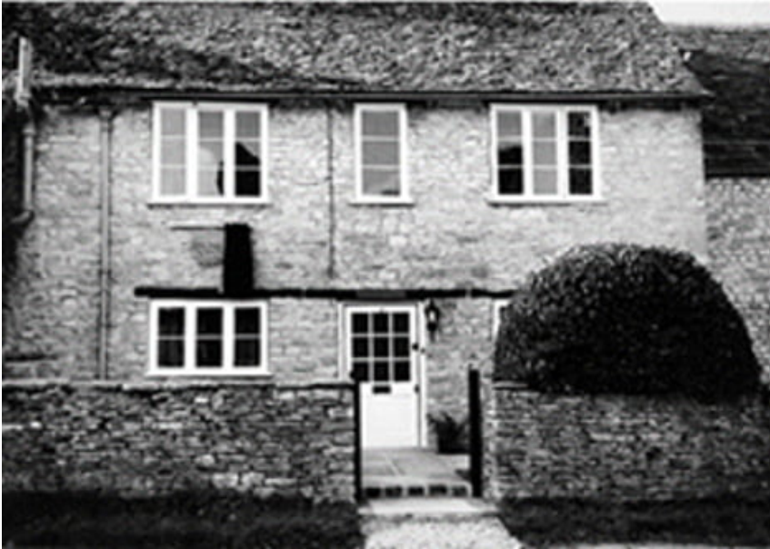
Barn Cottage en Finstock, Oxfordshire, donde Barbara Pym vivió de 1972 a 1980.