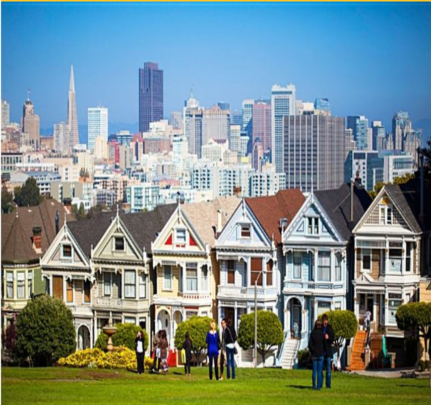
Vistas del centro desde Alamo Square Park ( Clickar ).