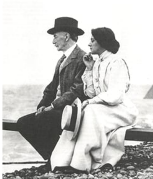
El escritor Thomas Hardy y su mujer Florence Dugdale en 1915.