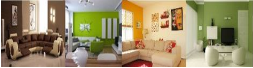
Figura N° 1